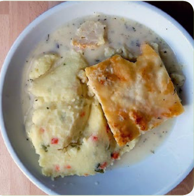
Blumenkohl mit Kerbelsoße und Frühlingspüree