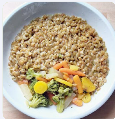
Grünkernrisotto mit Pfannengemüse