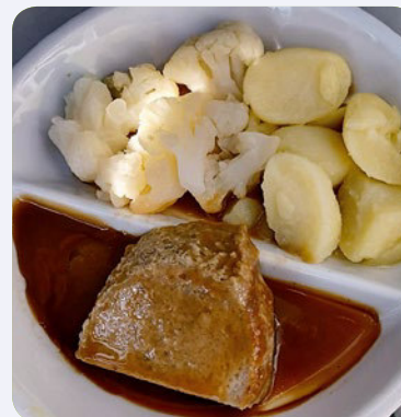
Hackbraten mit Blumenkohl und Kartoffeln