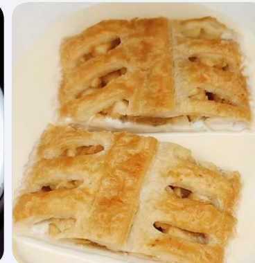
Apfelstrudel mit Vanillesoße