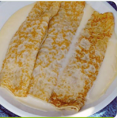
Mit Apfel gefüllte Eierkuchen mit Vanillesoße