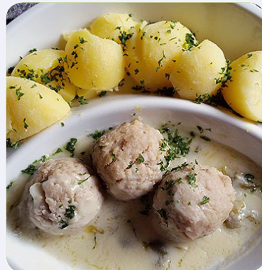
Königsberger Klopse mit Kartoffeln