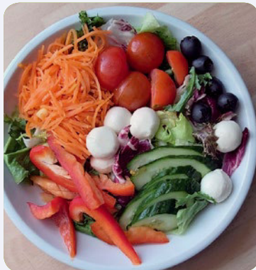
Mozzarella-Oliven-Salat mit Dressing