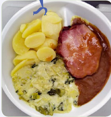
Kasslerbraten mit Rahmwirsing und Kartoffeln