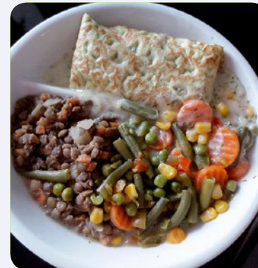
Veg. Hirtentasche mit Dill-Kräutersoße auf Linsenbett