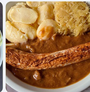
Thüringer Rostbratwurst mit Sauerkraut und Kartoffeln