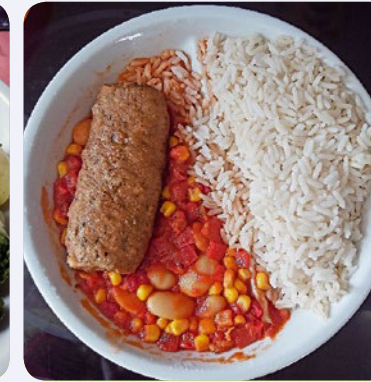
Frischkäse-Hirtenrolle auf Paprika-Mais-Bohngemüse