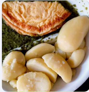
Gebackenes Eieromelette mit Kartoffeln und Spinat