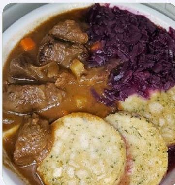
Zartes Hirschgulasch mit Apfelrotkohl und Serviettenknödel