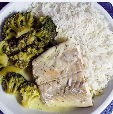
Fischfilet mit Brokkoli und Reis